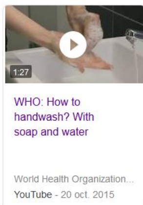
Organización Mundial de la Salud (OMS)