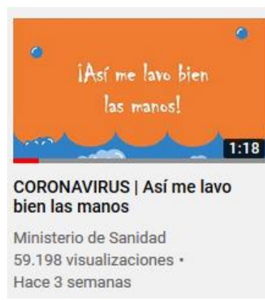
Ministerio de Sanidad Gobierno de España